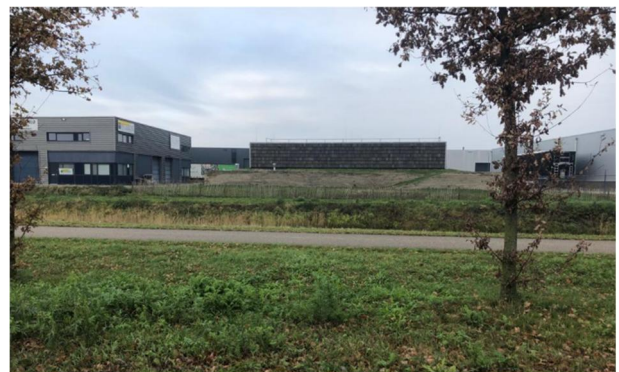
Foto schakelstation op De Laarberg

Gemeentes geven aan dat deze ontwikkeling hen ook verrast heeft. Maar op basis van het Beleid kan, mag en wil men geen regie nemen in het bepalen van zon-&windenergieprojecten en dus ook niet in zonnepark-locaties in ons gebied